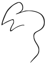
Happy hour Pablo Picasso